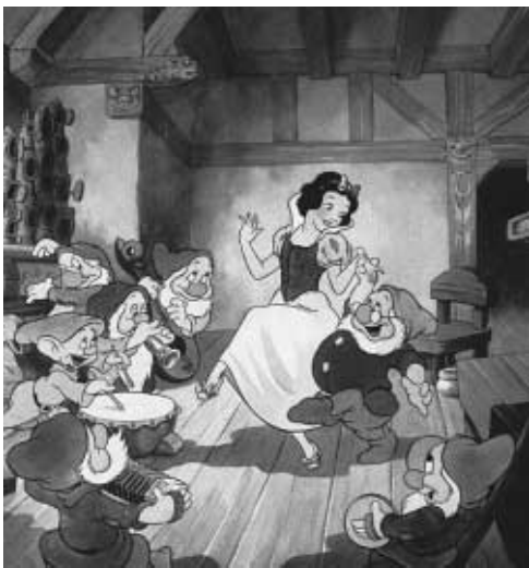
Blancanieves es aceptada en el grupo tras asumir las tareas del hogar

Envíe su pregunta a laconsulta@lavanguardia.es